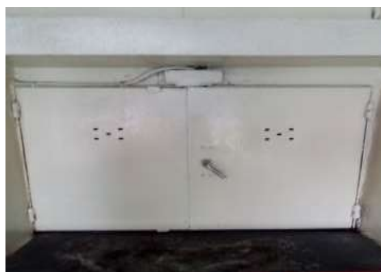
Прачечная (2 прачечные)