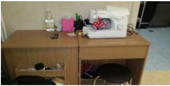
Комната для охраны